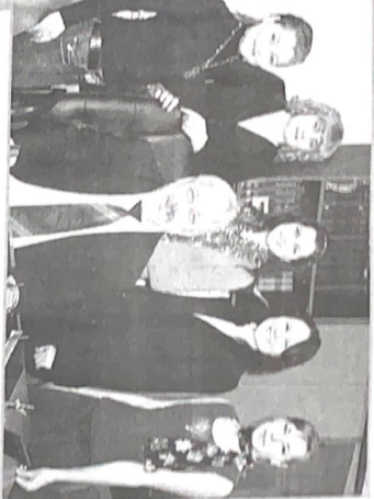
Виктория - значим побега!